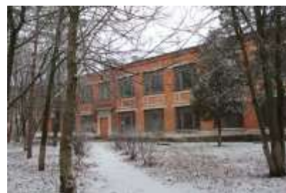
Учебный корпус №3