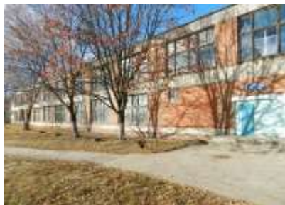
Учебный корпус №2