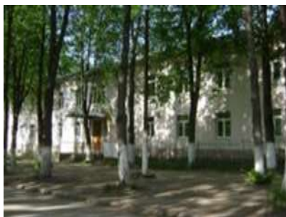
Учебный корпус №2