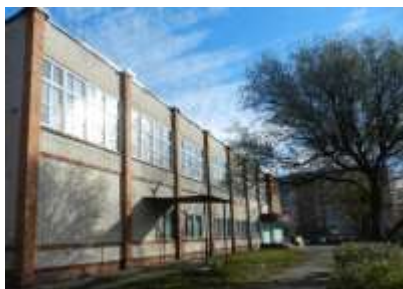
Учебный корпус №1