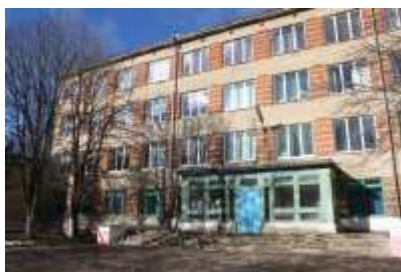
Учебный корпус №2