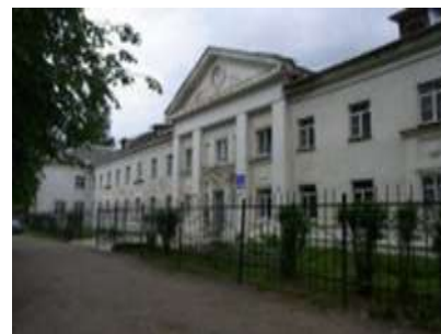
Учебный корпус №3