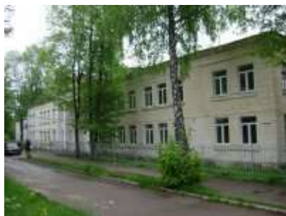
Учебный корпус №1