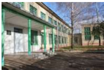
Учебный корпус №1